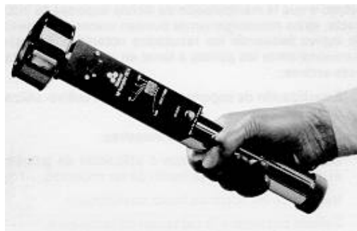
Fig. 3: Impactador RCS (Reuter Centrifugal System)

Partículas y microorganismos aerotransportados son proyectados por acción de la fuerza centrífuga sobre el medio de cultivo (Fig. 3).