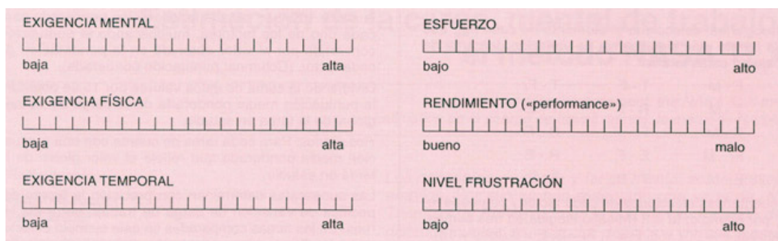
Figura 3 Escalas de puntuación

En esta fase de puntuación, las personas valoran la tarea o subtarea que acaban de realizar en cada una de las dimensiones, marcando un punto en la escala que se les presenta. Cada factor se presenta en una línea dividida en 20 intervalos iguales (puntuación que es reconvertida a una escala sobre 100) y limitada bipolarmente por unos descriptores (por ejemplo: elevado/bajo, como muestra la fig. 3) y teniendo presentes las definiciones de las dimensiones.